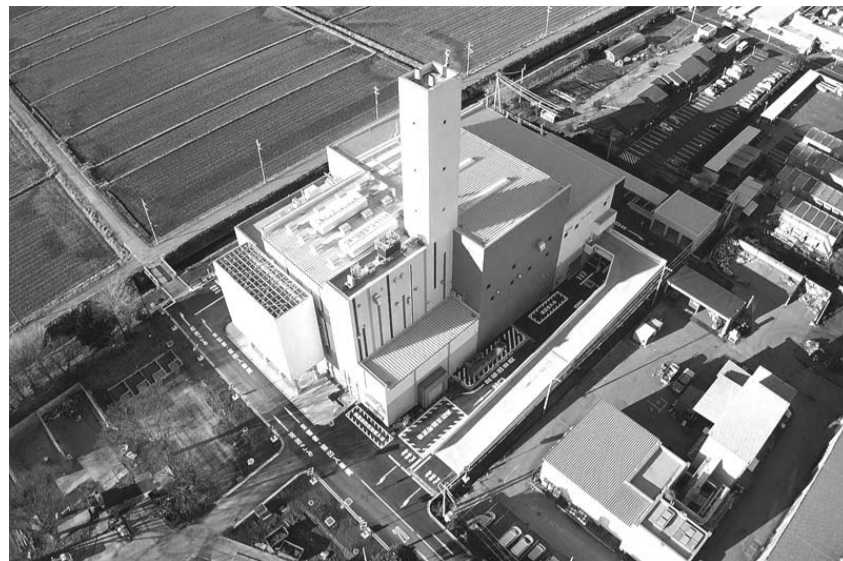
2023年度から本稼動する新クリーンセンター