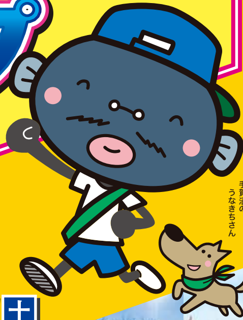
手賀沼の うなぎちさん