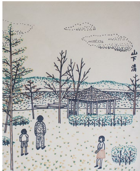
《手賀沼》ペン画 制作年不詳 個人蔵