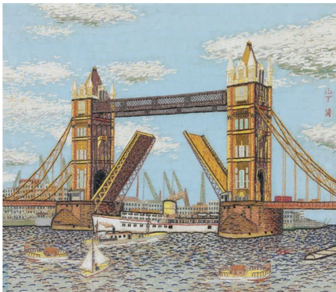
《ロンドンのタワーブリッジ》貼絵 1965年