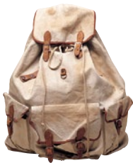
放浪中に使用したリュックサック