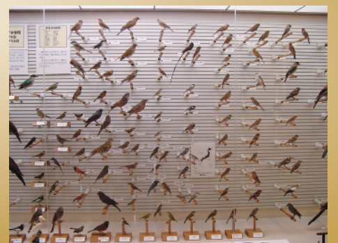
写真は過去に開催したコレクション展の様子です