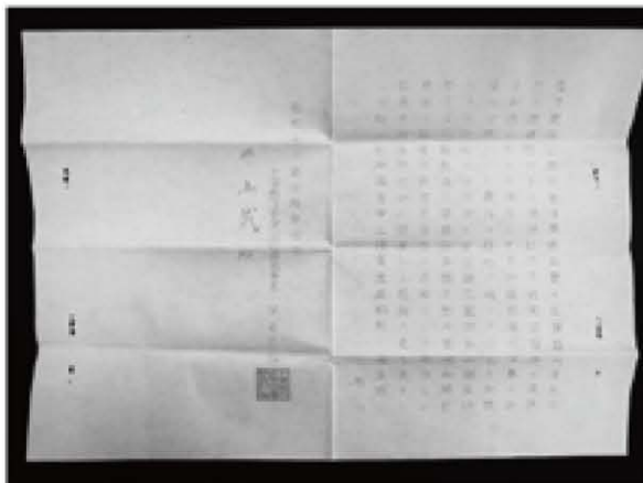
誘致断念を伝える手賀沼公園協会の通知