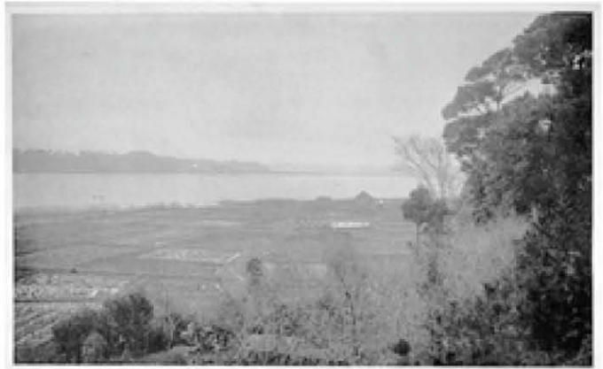
嘉納別荘から見た手賀沼