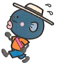
手賀沼のうなぎちゃん