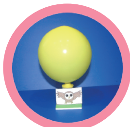
ふくろうホバークラフト 空気の力で、すべるように進みます！