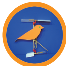
くるくるトリコプター