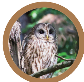
しらべてみよう！フクロウのごはん