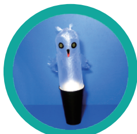
ゴーストミミズク