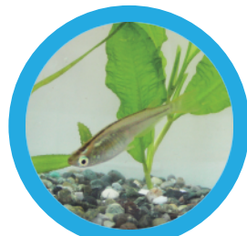
メダカでアクアリウム