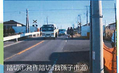
踏切① 発作踏切 (我孫子市道)