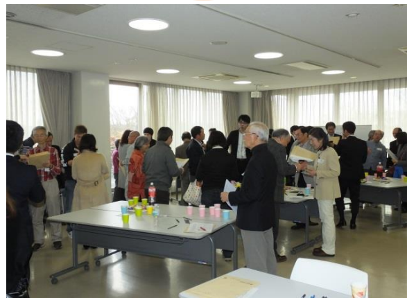
前回のビジネス交流会の様子(H28.2.13)