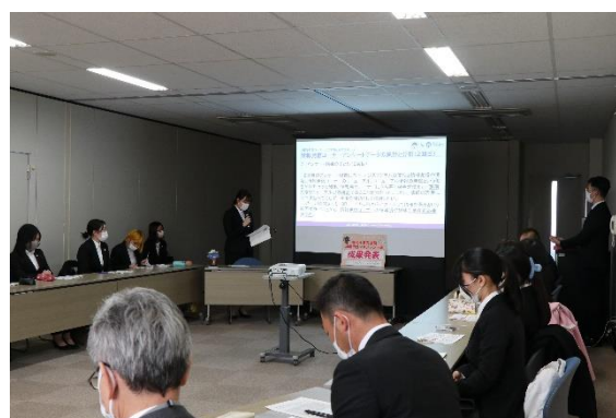
◆成果報告会 (昨年12月)

※取材を希望される場合は、前日までに企画政策課までご連絡いただき、当日は腕章の着用をお願いします。