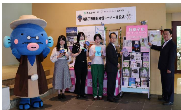
◆市情報発信コーナー開設 (昨年6月)

成果発表の中で、学生から「フィールドワークなどを通じて我孫子に触れたことにより、我孫子に関心を持てたので、他の学生にも我孫子に触れる機会を作りたい」と提案を受けたことから、今回のバス旅を実施します。