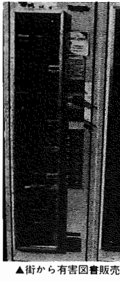
▲街から有害図書販売機をなくそう

「社会教育セミナー」。明日の子どもを考えると、親の役割が重要になってきます。社会教育セミナー。明日の子どもを考えると、親の役割が重要になってきます。社会教育セミナー。明日の子どもを考えると、親の役割が重要になってきます。