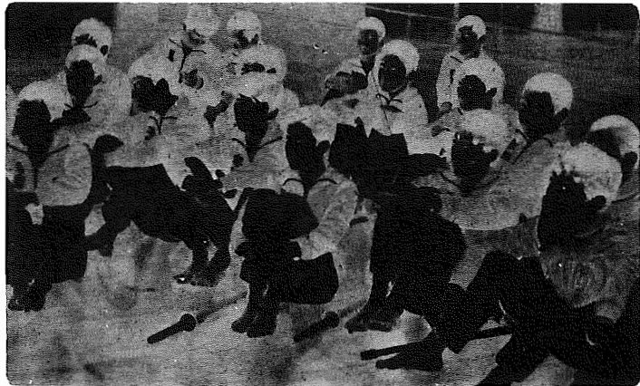
▲ゆるる子どもの心。回りの環境でどうにでも変わっていく

毎日のように新聞やテレビをきく子どもに関する記事やニュース。非行や自殺など、いまや世界各国でも深刻な問題となっています。戦後、豊かになった一方で、非行少年の数は著しく増えているのです。回りの環境に大きく左右される子ども。わたしたちはもう一度、家庭が、子どもの心身の成長に適しているか、じゅうぶんにエッジしなければなりません。また、この発会した青少年健全育成推進会議と少年センターをご紹介します。いずれも、健やかな子どもの成長のためのまちづくりを進めています。