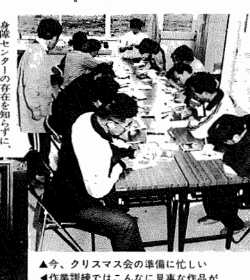
▲今、クリスマス会の準備に忙しい ▼作業訓練ではこんなに見事な作品が

市内在住の在宅障害者の通所に、よりハビリテーション活動を行う身体障害者福祉センターがオープンしてから2年半がたちました。年間延べ1,000名以上の人が、ハビリテーションを行っています。今年、訓練に励んでいます。今回は、この訓練の様相を紹介いたします。