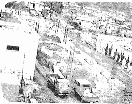
着々と進む一小増築工事

第一小学校は、児童の急増のためにプレハブ校舎十四教室での勉強を余儀なくされていますが、この解消をめざして増築工事が進んでいます。 工事は、本年七月二日に着工、来年の二月十日には鉄筋コンクリート四階建て普通教室十五室、特別教室（理科室など）二室が完成します。 面積は二、二四二平方メートル、総工事費に二億五千三百万円ほど投入します。新校舎が完成しますと児童を六七五名収容できる予定ですが、現在、プレハブ校舎で勉強している児童は六一〇名ほどいますので、この児童を全部収容いたしますこととなります。 当市は、人口の増加に伴い、児童生徒が急増しています。一小的の過去三年間の児童