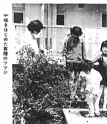
咲きはじめた寄贈のツツジ

▼市立我孫子中学校一年四組から、クラス会費の残金千四百十六円が寄付されました。市は、近く建設される予定の老人福祉会館の室内備品購入資金の一部に使用させていただきますことにしました。