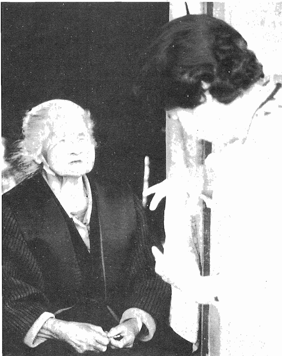
おばあさんの話し相手になり、クスリを届ける奉仕員