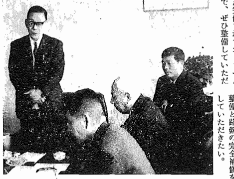
知事に現況を説明する町長

町の現状について説明を聞いた後、道路、県立高等学校用地を見て回りました。 ◎ 県立我孫子高等学校建設は、三年二十四学級規模の学校建設と運営を計画しており、四カ年で実現していただきたい。 ◎ 都市計画街路二・三・一(手賀沼沿岸道路)、県道我孫子二川線(日立精機前/国道六号線)および我孫子三原線は、市街地を東西に走っており、交通量の急増により、危険な状態になっています。交通安全の確保を図るためには、都市計画街路二・三・一、一(手賀沼沿岸道路)の早期完成以外にありませんので、公共事業等により促進を図っていただきたい。 ◎ 都市計画街路二・三・二(手賀沼沿岸道路)は、三井生命前部分については、車道と簡易歩道との差が二センチメートル位あり危険なうえに、電柱が歩道の中にあるため、歩行者および自転車の通行が困難な現状です。適切な措置を講じていただきたい。 ◎ 町道我孫子一三線、柴崎一三線は県道橋脚、取手線が完成するまでは、事実上県道の役割を果している現状にあります。この路線は、最近車両の通行が多く、特に大型車の通行が著しく、このため路盤の損傷がはなはだしいので、県道橋脚、取手線が完成するまでの間、県において補修していただきたい。 ◎ 都市計画街路一・三・二線(県道橋脚)取手線)常務委員増工により交差部分工事だけが現在行なわれておりましたが、大路線本来の機能を発揮させるため、県道一常務委員間、常務委員一国道六号線間の早期完成をしていただきたい。 ◎ 都市計画街路二・一・一線(天王台駅前線)常務委員孫子・取手間新駅が去る二月二十三日に承認され、昭和四十六年四月に開業を目前に国鉄当局と工事について協議を進めているところですが、この路線は、この新駅と県道我孫子三原線(重要路線)ともありますので、早期に補填の補助金がつきますようお願いします。また、県道として設定していただきたい。 ◎ 湖北台団地の賃貸住宅(二一、四三八戸)および分譲住宅(二〇〇戸)は、本年四月四日から入居が開始されますので、警察官派出所を新設するという形で設置していただきたい。