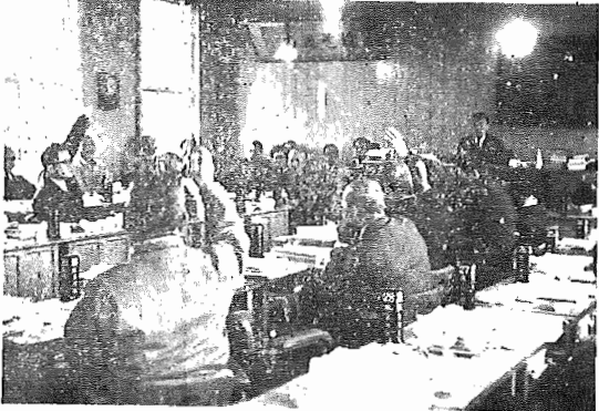
【才一回定例町議会採決風景】

すて、お知らせしたとおり、この初定例町議会は三月九日からはじまり、三十七年度の方針をきめると同時に、これからの町づくりの一環としてもこの議案は、議案五十九件(継続審議中のものを三件を含む)請願五件、陳情六件について審議されました。審議の結果議案一件、陳情一件を除き、可決または採択されました。なお、そのほか我孫子町を交通安全都市とすることについての議員提案が一件と、意見書二件が原案より可決されました。以下これらの諸案件の内容と審議結果について報告いたします。 ▼昭和三十一年度我孫子町町費入歳出予算(原案可決) この予算は、昨年の当初予算に比較して七千四百五十四万五千四百円増加して二億二千六百九十三万一千九百円となっております。予算のわしい内容については、別に記述がありますが、まず歳入の面では、前年度より増えています。大きなものは町税の一般四千万七千九百円、歳入全体の六十六%を占めています。ついで九・八%を占める国庫支出金の二千二百万円、八%の地方交付税、これは一千八百五十万円となっております。また、昨年の当初予算と比べて、社会及労働施設費で百二十二万円、保健衛生費 で三十六万円、予備費で三十一万五千円、全体の三・一%を占めております。町立保育所委託料二百六十四万円が最も多額です。保健衛生費は総額四百九十九万四千円となり、全体の二%を占めています。内容は、各種の予防接種費と八百八十七万円、全町内の消毒などのため環境衛生費二百二十七万円が計上されているのがおもなものです。 産業経済費は総額一千二百五十五万円、全体の五・四%を占めています。内容は、苗代・本田・緑虫防除などに二百四十二万円、中小企業に資金融資を行うための委託料三百二十万円、大型トラクター購入に百二十二万円などがおもなものです。 財産費は総額四十四万円で、全体の〇・二%を占めています。内容は、基本財産積立基金、県知事、町議会議員、町会長の選挙があるため増額とす。 統計調査費は総額四十三万五千円、全体の〇・二%を占めています。内容は、町費を占めるため二十万五千円計上して作成のため二十万五千円、全体の〇・二%を占めています。内容は、各年度に選挙費が総額百二十三万二千五百円に比較して、昨年当初予算に比較して倍増に達しております。三十七年度に農業委員、参議院議員、予備費は総額五十万円で、予備費は総額五十万円で、全体の〇・二%を占めています。 ▼我孫子町町費入歳出予算(原案可決) この予算は、昨年の当初予算と比べて、社会及労働施設費で百二十二万円、保健衛生費