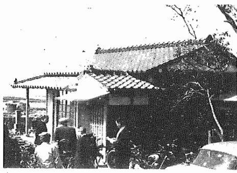
部落公民館を巡回調査する社会教育委員一行=完成したばかりの布佐下公民館

この調査は社会教育振興のため公民館、集会場の整備の必要がある。また、維持管理に必要がある。町民の生活の向上に資する施設として参考になる。巡回調査の結果は、教育委員、保健委員に報告される。また、公民館の活動の促進を図る。公民館の整備は、公民館の活動の促進を図る。巡回調査の結果は、教育委員、保健委員に報告される。