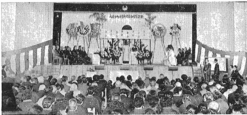
写真は戦破者合同慰霊祭