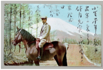
▲カルピス創業者三島海雲の絵葉書(杉村家蔵)