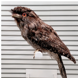
▲トーパーを行うオーストラリアガマグチヨタカの標本(鳥の博物館)