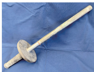
▲東京1964オリンピック聖火リレーのトーチ

6月23日(水)のみ東京2020オリンピック・パラリンピックのトーチを展示します!