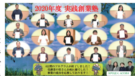
▲昨年度の修了生の皆さん

☎・☎ 5月27日(木)までに電話・ファクス・Eメールで住所、氏名、電話番号、Eメールアドレスを明示。NPO法人ACOB A ☎7181-9701 ☎7185-2241 ☎ acoba@key.ocn.ne.jp