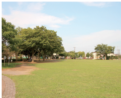
▲対象地1 (多目的広場の一部)

期間 10月15日(火)~23日(水) 場所 名戸ヶ谷あびこ病院内会議室(予定) 申込期間 10月4日(金)まで ☎・☎ 公園緑地課・内線544