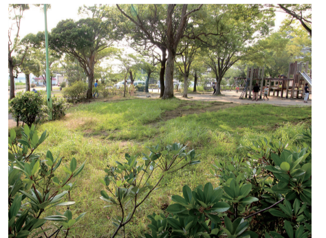
▲対象地2 (ボート乗り場前)

サウンディング型市場調査…公有地の活用などで公募条件を決定する前に、民間事業者から広く意見や提案を求め、話し合いを通して事業提案や市場性などを把握し、対象地のポテンシャルを最大限に高めるための諸条件の整理に役立つものです。