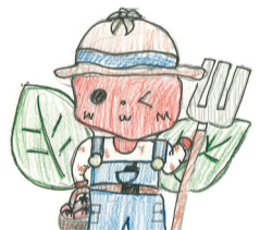
▲新木小学校児童考案 我孫子の農業PRキャラクター「トマト」