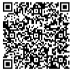
▲ちば電子申請サービス