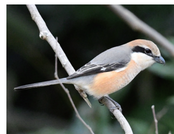
▲秋によく鳴くモズ