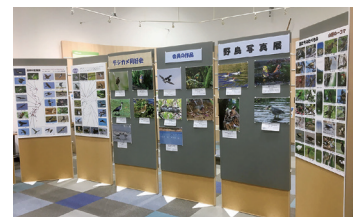
▲昨年の野鳥写真展の様子