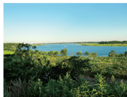
▲高野山桃山公園から見た手賀沼