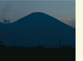
▲さまざまな山林の鳥たちが生息する富士山