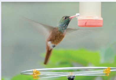
▲ホバリングするチャムネエメラルドハチドリ(多摩動物公園)