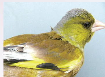
▲カムチャツカで捕獲した亜種オオカワラヒワ