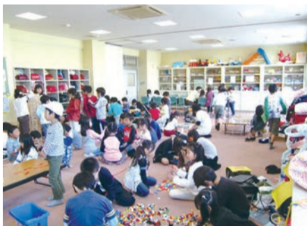
▲根戸小あびこ子供クラブ

範として認められ、「放課後子ども教室全国研究大会」で表彰されました。全国で66教室(53自治体)が表彰され、千葉県では「一小あびこ子供クラブ」が受賞しました。平成22年10月に市内2校目となる「あびこ子供クラブ」を根戸小学校にオープンし、本日6月1日我孫子第三小学校に3校目「あびこ子供クラブ」をオープンします。