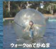
ウォーク on てがめま