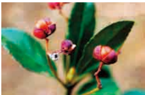
文・写真 佐久間 俊行

この土手の木は人家の庭から種子が運ばれて生育したものとされます。花期は六〜七月で、上向きにのびた柄の先に、緑白色で直径が七ミリほどの花を開きます。花は花弁、萼片、雄しべ共に四個です。花後にできる果実は球形で、直径が六〜八ミリになります。十一月、一月ごろ、紅色に熟して三〜四つに裂けると、中から橙赤色の仮種皮に包まれた種子が現れます。