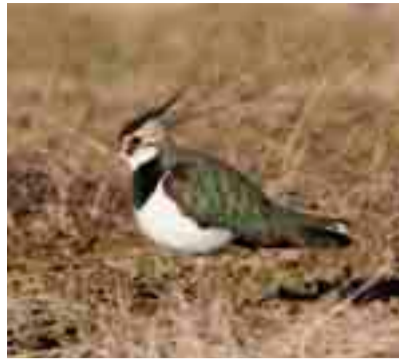
▲田んぼの冬鳥 タゲリ