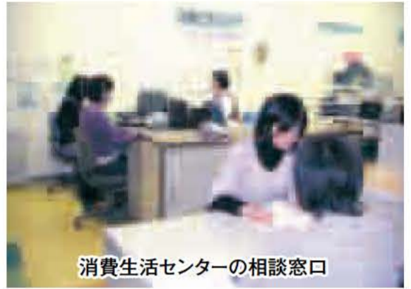
消費生活センターの相談窓口