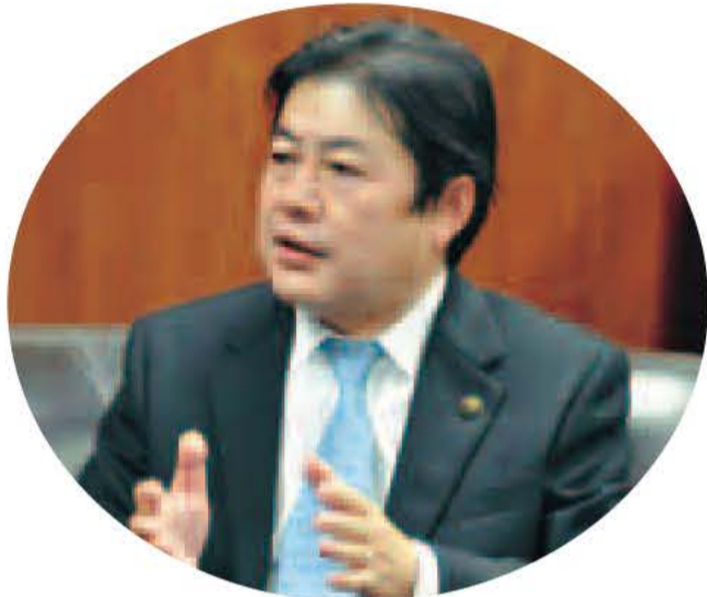
星野 順一郎 我孫子市長