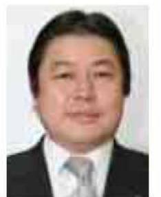
市長 星野 順一郎