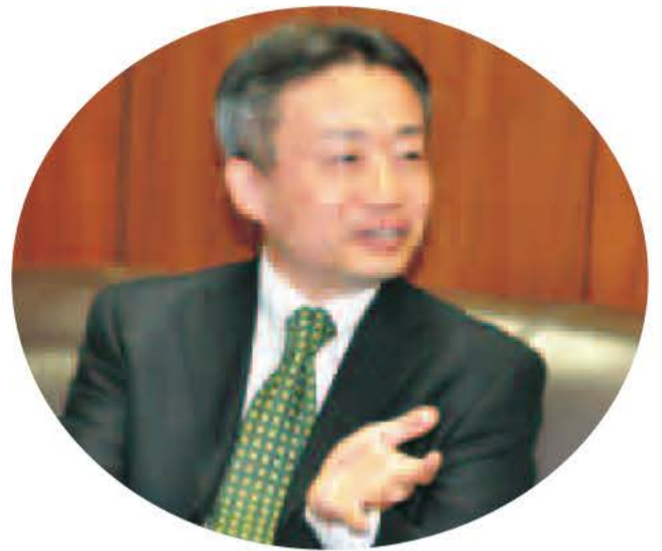
福嶋 浩彦 消費者庁長官