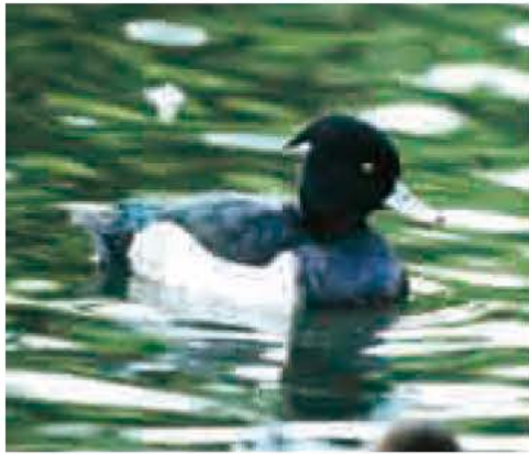
文 寺田 夏芽(鳥の博物館学芸員)