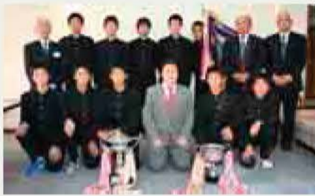
▲市長に優勝報告した我孫子中選手たち (インフルエンザによる学級閉鎖のため1人欠席)

11月5日に県立柏の葉公園総合競技場で行われた千葉県中学校駅伝大会で、湖北中学校女子が4位、我孫子中学校男子が優勝し、12月6日群馬県渋川市総合公園陸上競技場で行われる関東大会に出場します。さらに、我孫子中男子は、12月19日山口県で行われる全国大会に出場します。