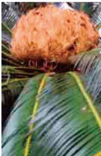
文・写真 佐久間 俊行

雄株を探すと、雌株のそばに植えてありました。雄株の花穂は大きな大根を逆立てたような形で、すでに役割を終えた雄の花穂は枯れて横たわっていました。