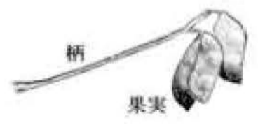
文・写真 佐久間 俊行

四月の中頃、我孫子駅から手賀沼公園へ下る坂道で、花と実をつけたスズメノエンドウに出会いました。スズメノエンドウは、カラスノエンドウより小型であることからつけられた名です。市内で見かけるスズメノエンドウは、カラスノエンドウ