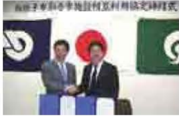
取手市と公共施設相互利用の協定締結式

我孫子市では、平成12年度から取手市と公共施設の相互利用を実施してきました。6月2日(火)からは、取手グリーンスポーツセンターと図書館に加え、藤代スポーツセンターと久賀テニスコートも取手市民と同額の料金で利用できるようになります。