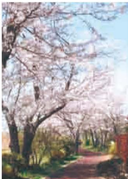
▲手賀沼遊歩道の桜並木

市の平成21年度当初予算が、3月の定例市議会で可決されました。一般会計は、前年度に比べ1・9%増の319億2000万円となりました。また、一般会計に6つの特別会計と水道事業会計を加えた予算総額は、前年度に比べ0・4%増の582億7310万円となっています。厳しい財政状況が続く中、一般会計予算が前年度よりも増額になりました。これは、当初予算で1年間を乗り切れる予算額すべてを計上したためです。特に、限られた財源の中で、子育て支援や安全・安心なまちづくりのための予算を重点的かつ効率的に配分しました。