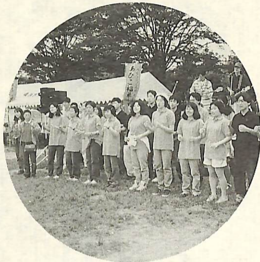
〈障害者と一緒楽しめる催しがいっぱい〉

青葉いつばいの季節。今年も恒例の「福祉まつり」を開催します。障害のある人も高齢の人も、大人も子どもも、みんなで一緒に自然とふれあひながら楽しい1日を過ごしてみませんか。ぜひ、ご家族、友だち同士でお出かけください。参加は無料です。 社会福祉協議会(84)1539