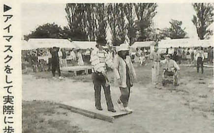
アイマスクをして実際に歩くことの難しさを体験