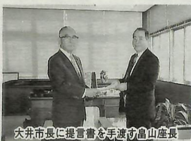
大井市長に提言書を手渡す富山座長