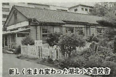
新しく生まれ変わった湖北小木造校舎

市では、湖北小学校の旧木造校舎を改装し、4月から「湖北小郷土資料室」を開設しました。 施設には、郷土に古くから伝わる民具や農具などの民俗文化財や市内の遺跡発掘調査で出土した土器や石