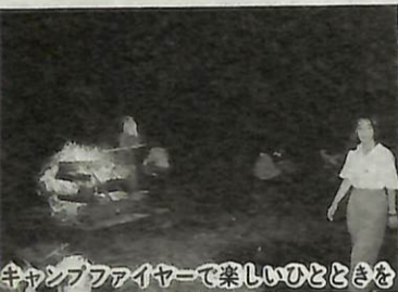
キャンプファイヤーで楽しいひとときを

器などの考古資料を展示する一方、埋蔵文化財の研究・整理も行っていきます。 湖北小の旧木造校舎は、昭和28年に建設され、これまで多くの子ども達を送り出してきました。現在、市内に残っている木造校舎は湖北小と二小の2校だけという貴重な建物です。見学は無料。皆さんも学習の場にお役立てください。 ▼開設日 毎週月曜日から金曜日午前9時30分から午後4時(ただし、祝日、年末年始を除く) ▼問い合わせ 教育委員会 社会教育課文化係 ☎(85) 151