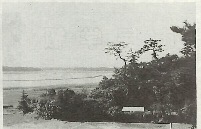
◀昭和30年代の手賀沼(現在の市民会館付近から)

昔の思い出の写真から当時の手賀沼を振り返ってみませんか。(このシリーズは毎月1日号に掲載しています)