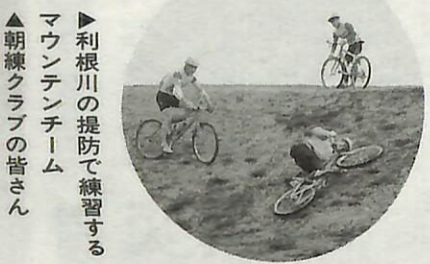
利根川の堤防で練習するマウンテンチーム 朝練クラブの皆さん