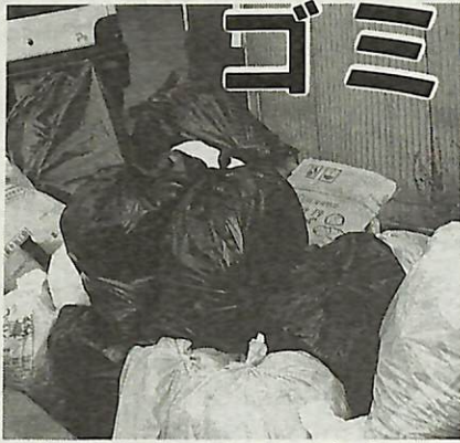
▲未だになくならない黒いゴミ袋