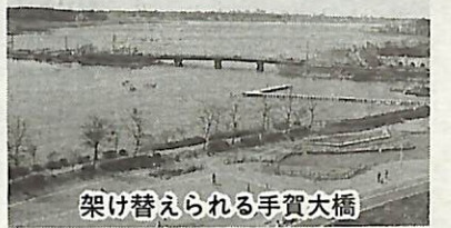
架け替えられる手賀大橋

本年度より、西消防署に高規格救急車を配備します。高規格救急車は救急現場と医療機関を伝送装置で結び、指導医の指示により救急救命士が特定の医療行為を行うことができ、今まで以上に救命率の向上が図られます。