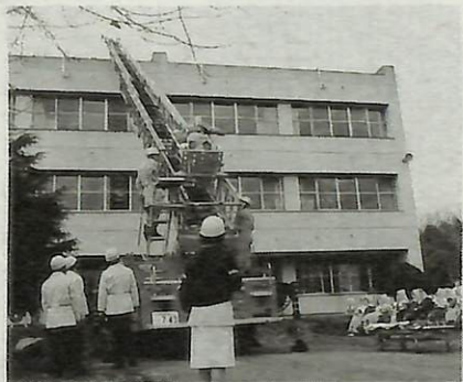
▶お年寄りを避難誘導する職員 ▲ハシゴ車で負傷者を救出

今回は、久遠苑の「3階倉庫から火災が発生」との想定で、避難・誘導訓練を開始。通報を受けたハシゴ車、救助工作車、救急車等6台がサイレンを鳴らして現場に急行。延焼中、屋根を求める看護婦を発見した消防隊はハシゴ車で速やかに救出し、負傷者の応急手当をした後、救急車で仮設病院へ搬送。万一に備え、老人ホームで救出訓練が行われたことは、たいへん意義深いものとなりました。