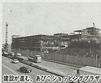
建設が進む、あびこショッピングプラザ

平成6年度も引き続き物件移転を行い、区画街路の整備、駅前通り及び駅前広場の早期完成に向け全力を傾注します。