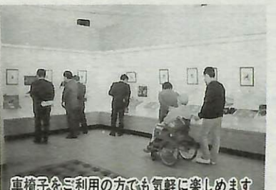
車椅子をご利用の方でも気軽に楽しめます

鳥の博物館では、第14回企画展「切手の中の鳥たち」を好評開催中。私たちが慣れ親しんでいる身近な切手には、意外と鳥のデザインをしたものを多く見かけます。 これらの鳥切手の中から61点を厳選し、生息写真などを展示。今までは、ひと味違った鳥切手の企画展をぜひ、ご覧になってみませんか。 ▼展示内容 *3月27日までは昭和36年から40年の自然保護シリーズ切手 *3月29日からは昭和58年から59年までの特殊鳥類切手第1集から4集など *4月12日以降は平成3年から5年の野鳥シリーズや水辺の鳥切手シリーズ第1集から7集の原画を展示 ▼展示期間 5月5日(祝) ▼問い合わせ 鳥の博物館 ☎(85) 2212