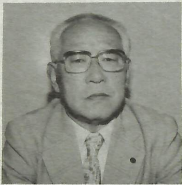
新木地区まちづくり協議会会長

近隣センターとしては、布佐南、天王台北、根戸に続き、市内4館目の(仮称)新木地区近隣センターが、平成6年3月の完成を目指し、作業が進められている。 「新木にも多目的な活動ができる施設ができますね。地元のみなさんの理解と協力が得られ、ようやくここまでできました」と笑顔を見せる。地元自治会、サークル団体の代表者41名により建設準備委員会が発足し、4月10日(土)、下新木集会所で行われた同まちづくり協議会設立総会で、新木地区まちづくり協議会会長となる。地元の自治会長を務めるな