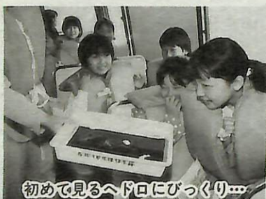
初めて見るヘドロにびっくり...

今年で3年目を迎える手賀沼船上学習が、市内の小中学校高学年を対象に4月23日(金)から始まりました。 これは環境保全課が、手賀沼の現状とすばらしさに実際に触れることで、水や自然の大切さを知ってもらおうと毎年実施しているもの。 初日は肌寒い天候のなか、高野山小学校の6年生154名が参加。市職員が、パネル等を使って手賀沼の現状や昔のの様子を説明すると、熱心に聞いていました。 また、実際に沼の水やヘドロを見るとびっくり。子供たちはそれぞれの浄化への願いをこめて「手賀沼を汚さないようにしたい」とか、「死んでいた魚がかわいそう」といった感想文をまよとめました。