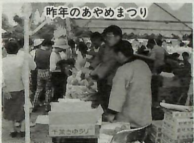
昨年のあやめまつり

今年も水生植物園の花菖蒲の開花にあわせ、第10回あやめまつりを開催します。あやめまつり実行委員会では、催し物のメインとなる青空市の出店者を募集します。