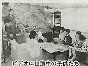
ビデオに出演中の子供たち

6月1日(火)から貸し出し申し込み受付 近年の使い捨て時代を反映して、ごみの増加が大きな社会問題となっています。市では、市民のみならずの協力を得て、ごみの減量と再資源化を行い、大きな成果を上げています。 このビデオは、市内の小学校を対象に教材として配布するほか、市民のみならずへの貸し出しも行います。ぜひ、ご利用ください。 ▼貸出受付日時 6月1日(火)から、土曜・日曜日、祝日、年末年始を除く毎日、午前9時から午後4時 ▼申し込み・問い合わせ 電話でクリーンセンター(87)0015へ