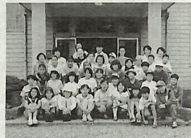
▶昨年参加した子どもたち