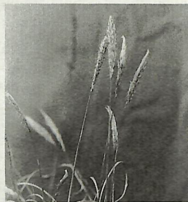
四月も末になると、野や道端で白い花穂が風に揺れるチガヤ