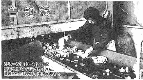
シリアズ門く=資源回収 真夏の中暑に気を付けてください。 負傷者には水分を補給してください。

平成元年6月1日現在 (対前年比) *人口119,739人(+2,644人) 男60,167人 女59,572人 *世帯数37,803世帯(+1,140世帯)