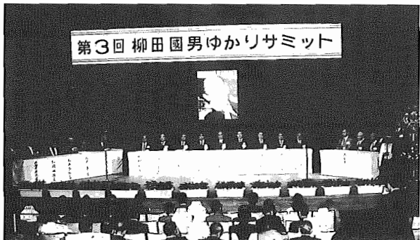
第3回 柳田国男ゆかりサミット