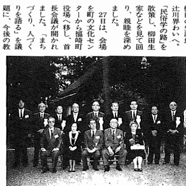
柳田国男生誕の前で子息らと共に記念撮影するサミット参加区市町村の首長