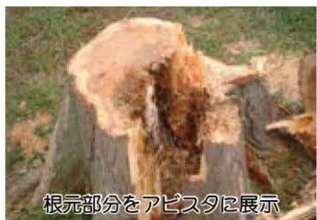
根元部分をアピスタに展示

そのため市は、樹木医にポプラ健全度調査を委託しました。調査では、すべてのポプラが病害虫に侵されていることが分かり、費用をかけても長期保存は難しいということでした。さらに市民の皆さんの意見・提案をお聞きして、あらゆる面から検討を重ねてきました。その結果、公園内の樹木としての安全性を