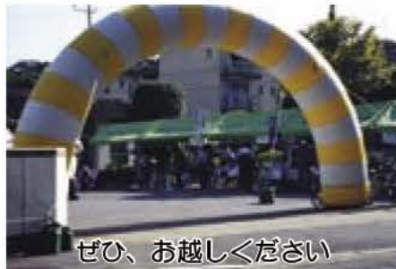
ぜひ、お越しください

知的障害者更生施設「あらき園」では、日頃の活動を知ってもらい、地域との交流を深める機会としてあらき園祭を開催します。ご家族で、ぜひお出かけください。 日時 9月26日(日)午後1時から3時15分 (雨天実施) 場所 あらき園 (入場無料) 内容 吹奏楽演奏、ダンス、ゲーム、喫茶、活動内容紹介、市内福祉施設の出店 ☎ あらき園 ☎7188-4188