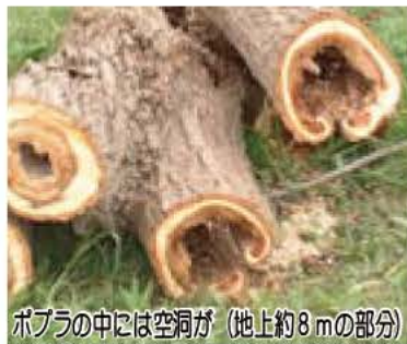
ポプラの中には空洞が (地上約8mの部分)