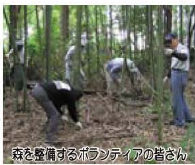
森を整備するボランティアの皆さん

沼の南側はハンノキやコナラなどの斜面林と湖面が一体となり、美しい景観を今なお残しています。 自然観察の森ゾーンの西側1.1ヘクタールの緑地は、「古利根公園」自然観察の森としてすでに市民開放しています。この森では、市で公募したみどりのボランティアが、散策路の整備や下草刈り、枯木の伐採などの作業を行っています。