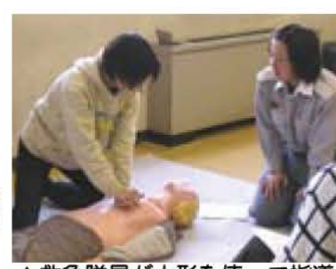
▲救急隊員が人形を使って指導

普通救命講習会 いざというときのための 応急処置を学びませんか 消防署では、バイスタンダー(その場に居合わせた応急処置のできる人)を育成するため、普通救命講習会を開催します。 救急隊員が人形を使って、人工呼吸や心臓マッサージ、止血などを指導します。 日時 9月25日(土)午前9時から正午 場所 久寺家近隣センター 内容 一人法の心肺蘇生法、大出血時の止血法の指導 対象・定員 市内在住・在勤で健康な方、先着30人 参加費 無料 ※講習後、救命技能適正と認められた方には修了証を交付します。 申し込み・申込先 直接または電話で9月15日までに消防本部警防課 ☎7181-7701(土・日曜日、祝日と夜間は ☎7184-0119)へ