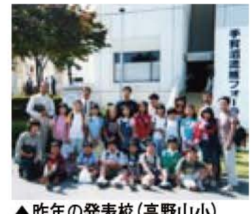
▲昨年の発表校(高野山小)

秋の剪定教室 花と緑あふれるまちづくり 家庭樹木の剪定教室です。1日目は病害虫に関する内容の講義。2日目は生垣、花木類などの剪定実技を行います。 日程・場所 表参照 講師 樹木医 対象・定員 講義、実技とも参加費 1000円 申し込み 往復ハガキ(1人1枚)に「剪定教室」「希望コース番号(①~④)」を第3希望まで、住所、氏名、性別、年齢、電話番号、返信用に「あて名」(様としてください)を明記し、9月7日必着で〒270-1192 市役所公園緑地課(住所省略可)へ 申込先 公園緑地課 内線545 ※車での来場はご遠慮ください。