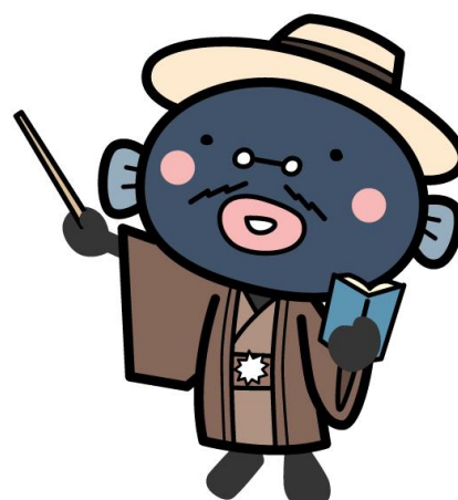
我孫子市マスコットキャラクター 手賀沼のうなぎちゃん