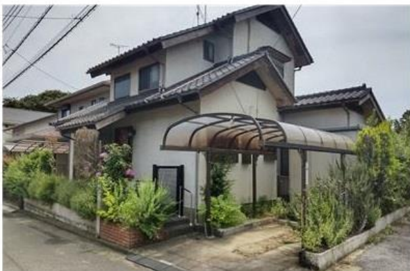
2Fからの見晴らしが良く、開放的です♪

JR成田線・新木駅歩24分 布佐駅 徒歩20分 間取り・5LDK 建物面積・119.93㎡ 高台の角地 築年月・1987年01月 新耐震基準の建物 布佐平和台・建築協定・有 角地 高台で2階からの眺望良し 日当たり良好 広い土地「約78坪」 広い庭 カーポート有 窓が多く開放的 住環境良し 近くに総合病院あり [木戸公園]・隣 浴室はリフォームして、とても綺麗。 システムキッチンその他 収納スペース多数 閑静住宅地 周辺は、綺麗な街並みです。