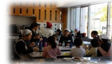
我孫子地区公民館講座