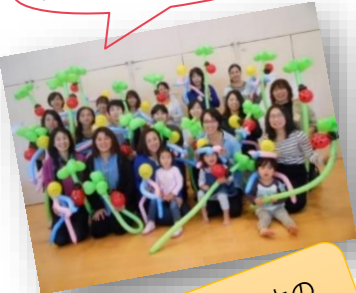
学級生の感想です

小学校入学は、子どもにとって社会参加への大きな第一歩！新しい環境で、不安に思うこともあるかもしれませんが。また初めて子どもを入学させる保護者には「小学校」ってどんなものか、親としての心構えなど不安に思うこともあるかもしれませんね。52年の実績を持つ家庭教育学級は、講義や体験など多彩なプログラムを通して家庭・親子・地域への関わりを、同じ年齢の子を持つお母さんたちと一緒に楽しく学べる講座です。