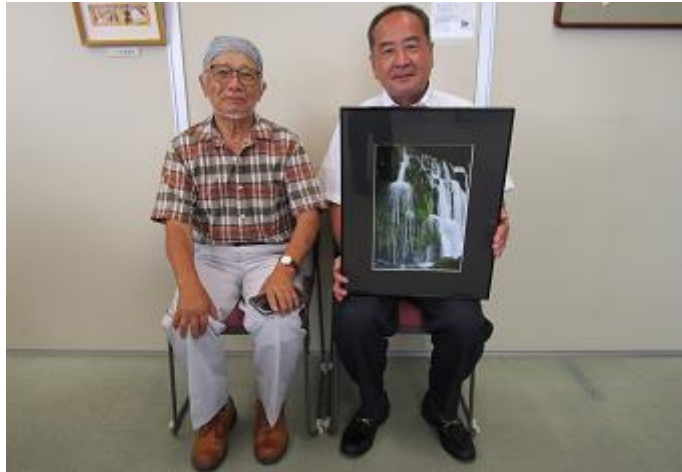
田谷様より写真の贈呈式の写真