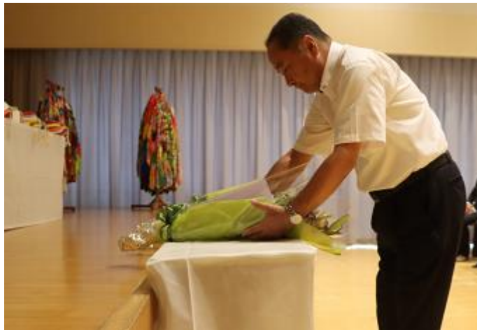
被爆79周年平和祈念式典の写真