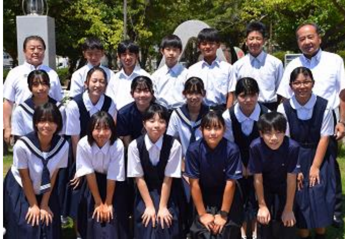
被爆79周年平和祈念式典の写真