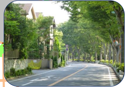
2 湖北台のまちなみ