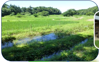
谷津ミュージアム 作業小屋