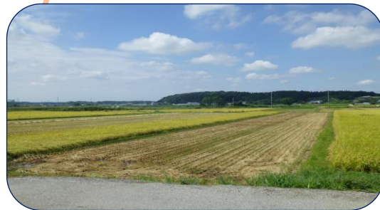
5 広大な手賀沼干拓地