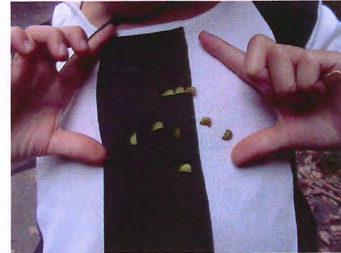
又スビトハギがくっついたところ

ひっつきむしといっても虫ではありません。ひっつきむしとは植物の種子です。人や動物にくっついて遠くまで種子を運んでもらうという植物の戦略があります。種子の表面にイガイガがあったり、ネバネバがあったりしてくっつきやすくなっています。