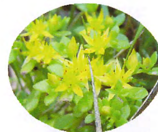
コモチマンネングサ