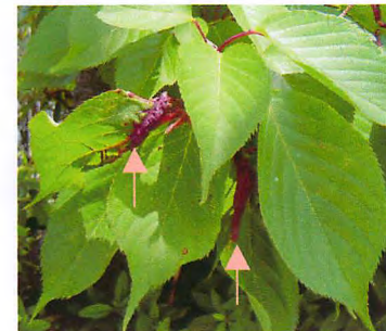
ソメイヨシノの虫こぶ

ヒメマルカツオブシムシ アジサイの花粉を食べにやって来たようです。幼虫は毛織物や乾燥した動物質の衣類を好んで食べます。