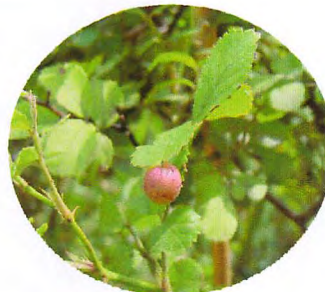
ノイバラの虫こぶ

これはノイバラの実ではありません。「虫こぶ」と言って昆虫やダニなどが植物に寄生してできます。(ノイバラにはバラタマバチの幼虫が寄生します)