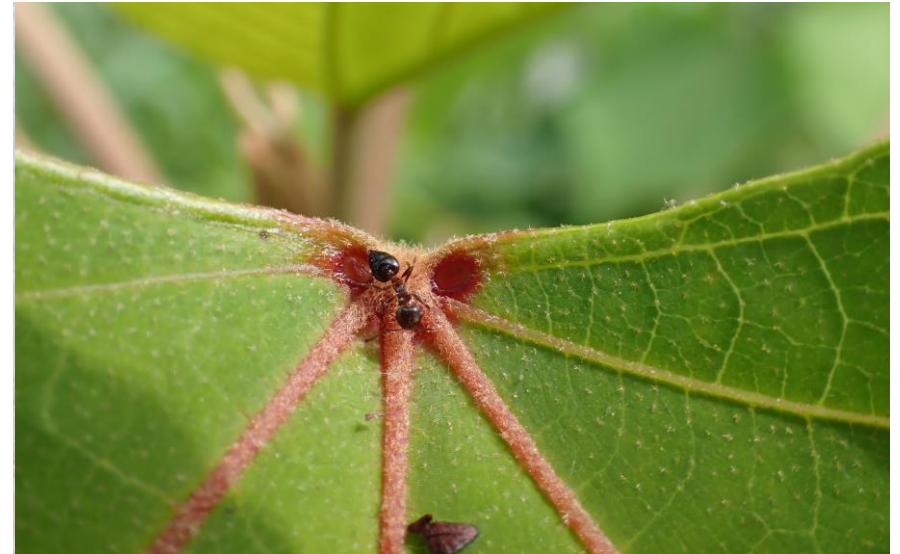
▲アカメガシワの蜜腺をなめるテラニシシリアゲアリ。

アリは身近なところで見られる昆虫です。小さな種類は全長1mmほど、大きな種類でも最大2cm程度で、女王アリを中心とした家族で巣穴を作って暮らしています。てがたんコースで見られるアリはどんな種類が見られるのでしょうか。また、アリとその他の生き物との関係にも注目してみましょう。