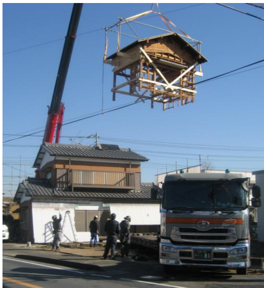
再利用するためトラックに積み込まれる被災住宅

被災した住宅の解体工事が十一月から本格化し、一月二十五日までに、十六棟の解体が完了しました。被災家屋の解体は、今後二十九棟の工事を予定していますが、一部を除き、三月末までの完了を目指していきます。 なお、解体した建物の一部は、秋田市に運ばれ、グループホームに再利用されます。